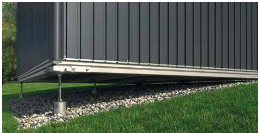
Mit den Standard-Erdschrauben können Bodenunebenheiten und Hangneigungen bis zu 10 % Gefälle ausgeglichen werden. Für größere Höhenunterschiede sind Verlängerungen auf Anfrage erhältlich.