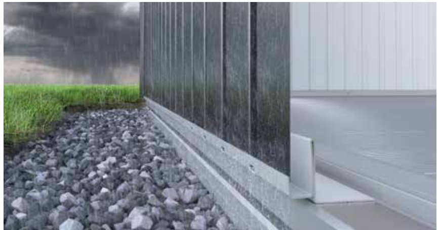
Das Erdschrauben-Fundament enthält eine integrierte Wasserbarriere, wodurch der Regenwasserablauf bestens gelöst ist.

Demgegenüber wird das auf Biohort Produkte perfekt abgestimmte, patentierte Erdschrauben-Fundament kurzerhand montiert, sodass umgehend mit dem Aufbau begonnen werden kann. Die integrierte Barriere verhindert Wassereintritt im Gerätehaus, Bodenunebenheiten und leichte Hangneigungen werden über Adapter ausgeglichen. Die Aludielen sind ein widerstandsfähiger, belastbarer Boden für das Haus.